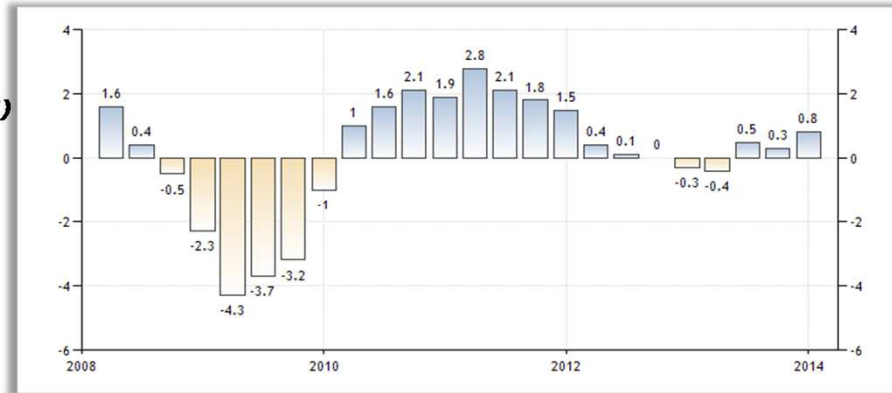
Andamento del PIL in Francia (2008-2014 variazioni % trimestrali)